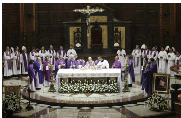
Obispos salvadoreños celebrando la Eucaristía

Commemorando la festividad de Nuestra Señora de la Paz, Patrona de El Salvador (21 de Noviembre 2005), los Obispos invitan a los salvadoreños en general y a los cristianos en particular a una reflexión profunda y objetiva sobre el fenómeno de la violencia, sus causas, el contexto en que se desarrolla así como sus consecuencias de muerte y desintegración social (Nos. 9 - 25).